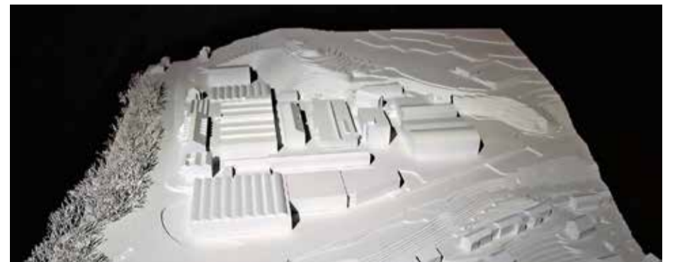
Ein Modell des Arova-Areals mit Relief.

Auf der Basis des Workshops wird nun ein Konzeptentwurf in Varianten erarbeitet, gefolgt von einer Konzeptvertiefung und Vorgehensempfehlung. Im dritten Quartal dieses Jahres steht dann ein weiterer Workshop, an dem man über den Konzeptentwurf, die Innenentwicklung und den Freiraum diskutieren wird.