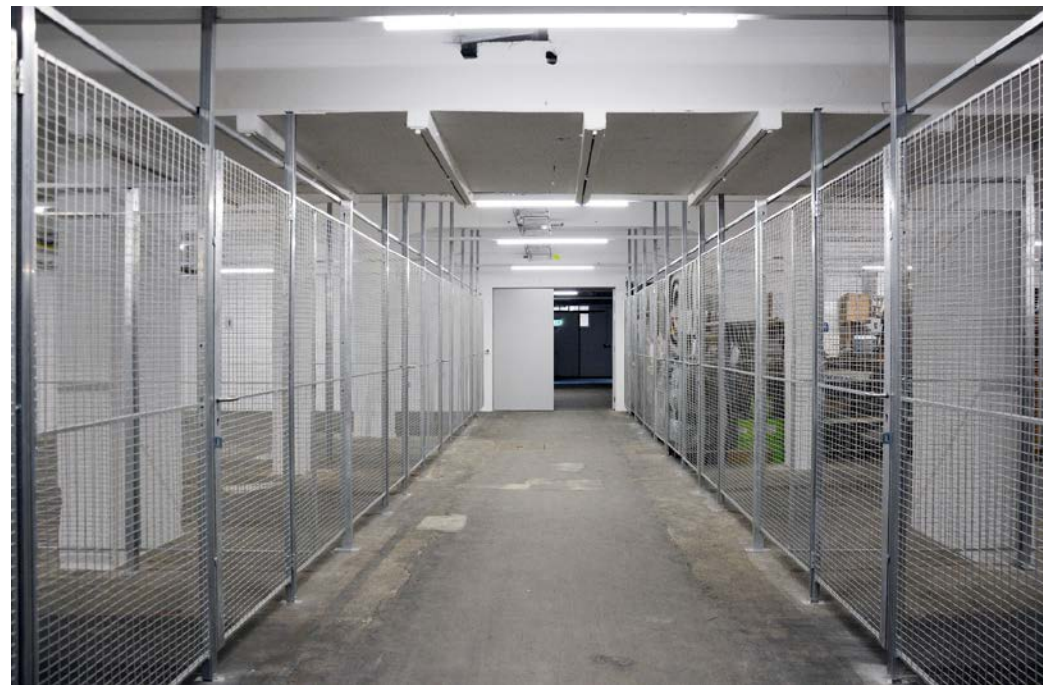
Lagerflächen 1. UG