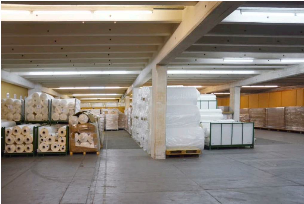
Mietfläche 2. UG