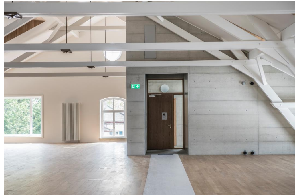
Mietfläche 2. OG